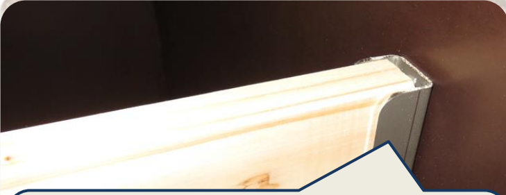
Die Sitzstangen sind gesteckt und können ohne Werkzeug abgenommen werden. Das Reinigen und das Einölen der Sitzstangen erfolgt bequem ausserhalb des Stalls.