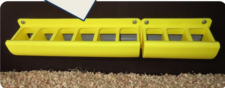
Die Futterbehälter innen an der Wand