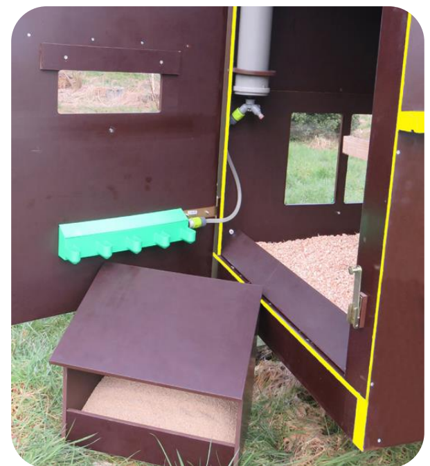
Die Gruppen Legekästen können zum Reinigen ohne Werkzeug abgenommen werden.