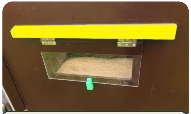
Die Entnahme der Eier aus den Gruppen Legekästen, erfolgt durch die Klappe von aussen