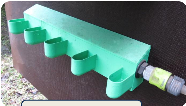
Die automatische Tränke mit Schwimmerventil