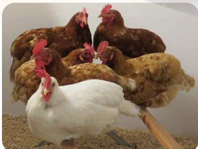
Alle Komponenten wurden von unseren Teams getestet